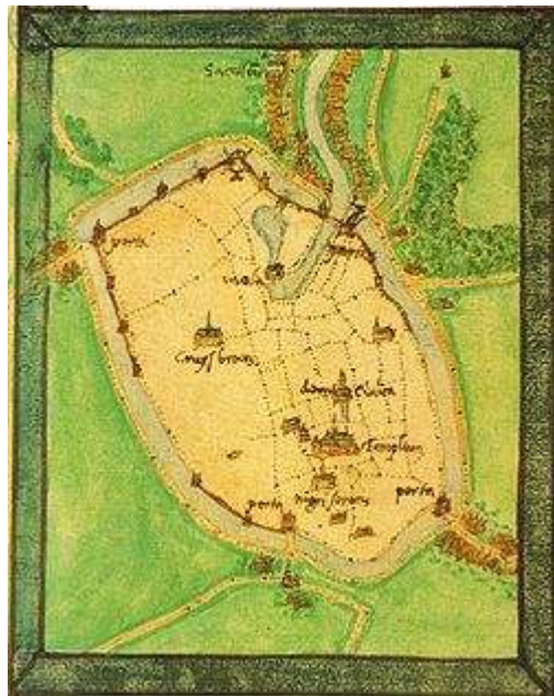
Goes met omwalling (kaart door Jacob van Deventer)

Waar nu de ophaalbrug ligt, bij het begin van de Grote en Kleine Kade, lag de Oude Havenpoort. In 1635 kwam er de huidige Nieuwe Havenpoort, iets verderop aan de J. A. van der Goeskade. En dan was er nog de Poort naar de Oostschans of de Bleijkveldse Poort waar nu het begin van de Albert Joachimikade is. Het gebied ten oosten van de Oostvest en van de haveningang was Kloetings grondgebied. In 1554 was er een grote brand waarbij een kwart van de stad afbrandde. Na de brand ging men stenen huizen bouwen, bijvoorbeeld de monumentenpanden die nu aan de haven in de stad staan. Rond 1570 moet Goes ongeveer 2500 á 3000 inwoners hebben gehad.