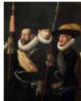
Deel schilderij schuttersgilde

Een parure was een draagspeld waaraan men kon zien dat iemand lid was van een bepaald schuttersgilde. Het lidmaatschap was belangrijk omdat je alleen lid kon worden van het stadsbestuur of van een van de hogere colleges als je schutter was.