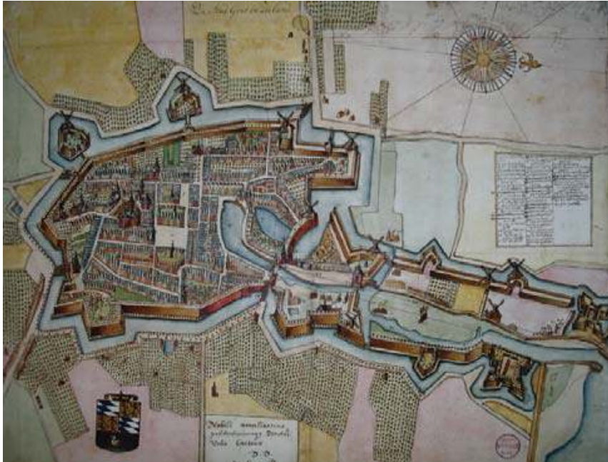
De stad Goes ca. 1650 (door Jacob Reynoutsen)

Op het kaartje hieronder zijn ze helemaal rechtsonder te zien. Bijzonder was dat de fortificaties helemaal doorliepen tot aan de toenmalige Schenge. Ook zijn de uitstekende delen van de fortificatie langs het water, de bastions, goed te zien. Die hadden het voordeel dat de belegeraars vanuit verschillende hoeken onder vuur genomen konden worden.