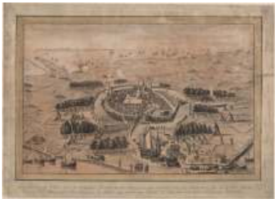
Beleg van Goes in 1572

De onkosten die Goes had gemaakt voor het garnizoen werden niet vergoed. Bovendien had de handel stilgelegen en waren de zoutketen in vlammen opgegaan. Goes zat financieel aan de grond.