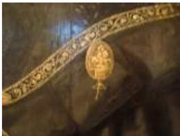
Voorbeeld van een parure