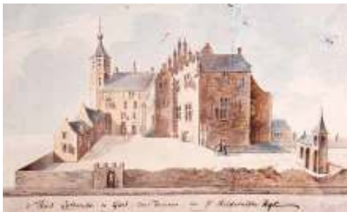
Slot Oostende met bijgebouwen